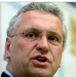
Joachim Herrmann: Ziel der Gesetzesänderung ist es, „eine beginnende Gewaltspirale von Anfang an zu stoppen“

Innenminister Herrmann fordert die rasche Ausweisung ausländischer Gewalttäter - und will einen Gesetzentwurf in den Bundesrat einbringen.