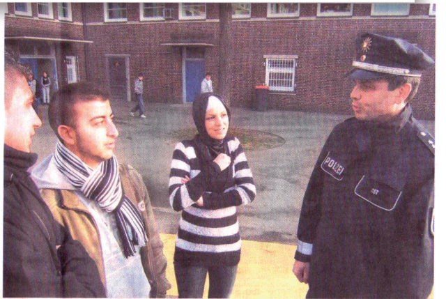
Polizeipräsenz auf dem Schulhof — hier eine Szene aus Hamburg — ist eines der Mittel, Gewalt einzudämmen.